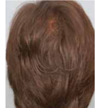
Nach 3 A-PRP Behandlungen